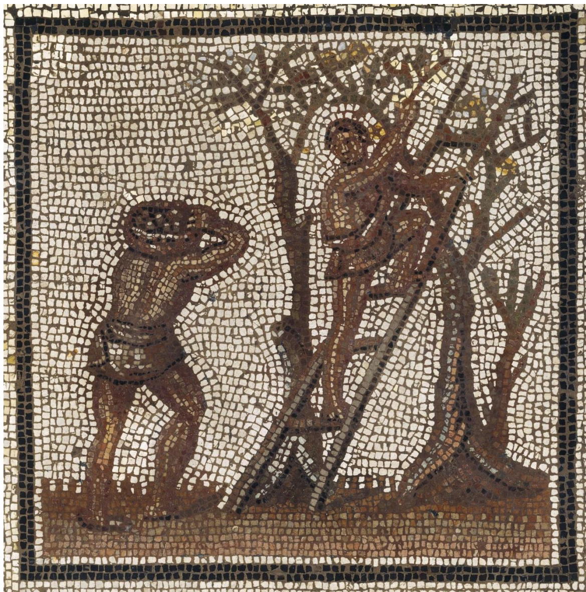
Mosaïque du calendrier agricole de Saint-Romain-en-Gal détail : "La cueillette des olives"